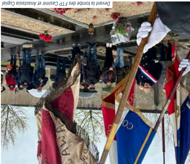
Devant la tombe des FTP Casimir et Anastasia Cupjal

La matinée s'est poursuivie sous le signe du souvenir. Accompagnés des porte-drapeaux et de représentants de la famille Cupjal, les élus se sont rendus au carré militaire du cimetière-ville. Une gerbe a été déposée sur la tombe de Casimir et Anastasia Cupjal. À travers ce geste, la Municipalité a souhaité honorer la mémoire de l'ensemble des Commentryens et Commentryennes victimes de la guerre, et le courage des aînés engagés dans la lutte contre le fascisme.