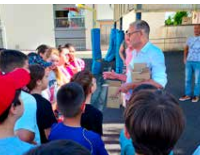
La Ville s'engage pour la réussite de ses jeunes et le pouvoir d'achat des familles.

La Municipalité, soucieuse de soutenir les familles et de garantir la gratuité de l'éducation publique, offre un kit de fournitures scolaires à tous les collégiens commentryens. La distribution a lieu le samedi 27 juin au guichet famille, afin d'accompagner le pouvoir d'achat et de favoriser de bonnes conditions de scolarité. Pour celles et ceux