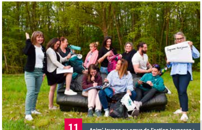
11 Anim'Jeunes au cœur de l'action jeunesse : retrouvez le programme dédié aux jeunes durant cet été des pages 11 à 14.