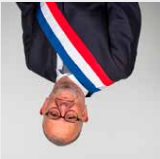
Sylvain BOURDIER Maire de Comentry