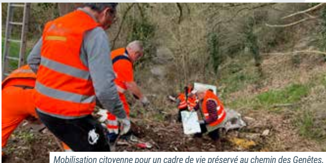
Mobilisation citoyenne pour un cadre de vie préservé au chemin des Genêtes.

Le 6 mars 2026, une opération de nettoyage s'est tenue chemin des Genêtes à Commentry, dans le cadre de « J'aime la Nature Propre ». Des agents du CTM (Centre Technique Municipal), un élu et les chasseurs de Signevarine se sont mobilisés pour ramasser les déchets. Cette initiative de la Fédération des Chasseurs vise à sensibiliser à la protection de l'environnement et à encourager l'engagement citoyen.