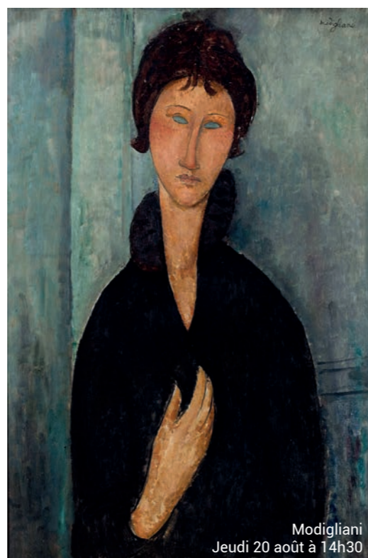
Modigliani, Jeudi 20 août à 14h30

En mai, retrouvez la collection Impressionnisme