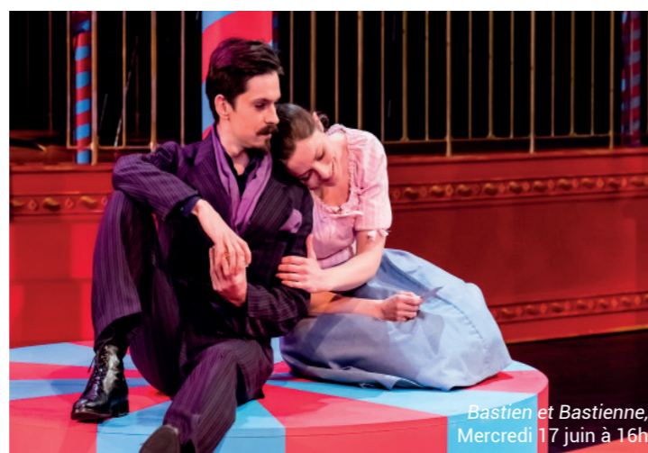
Bastien et Bastienne, Mercredi 17 juin à 16h

>>> Les micro-ateliers pour étudier une pratique et la tester par soi-même, et partager vos talents.