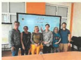
Journée Bien être au travail juin 2024