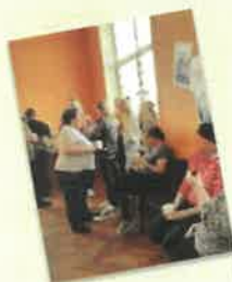
Journée de l'aide à domicile Mars 2024

La CARSAT a autorisé, suite aux difficultés rencontrées par le secteur de l'aide à domicile, à facturer aux usagers un dépassement horaire. Le CCAS de Commeny a acté cette démarche et a appliqué à compter du 1 er octobre 2024 un dépassement horaire de 2,30€. Par ailleurs le tarif à taux plein a été revu à la hausse pas de 25,85 à 28,60€/heure afin d'absorber les augmentations de SMIC décidées en 2024 (janvier et novembre).