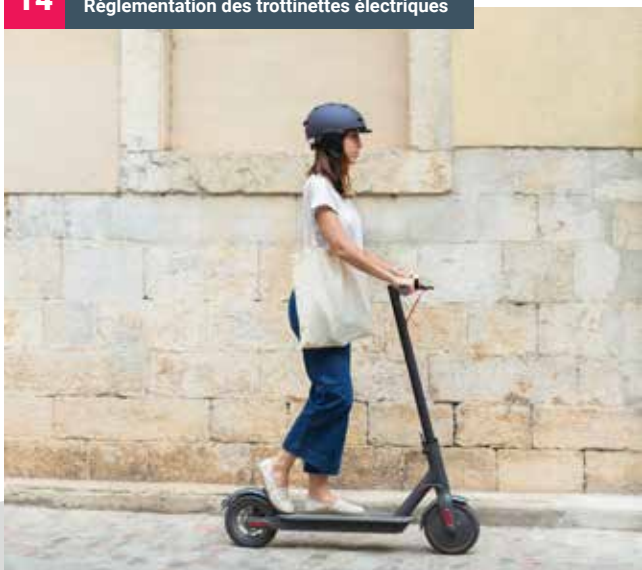
Règlementation des trottinettes électriques