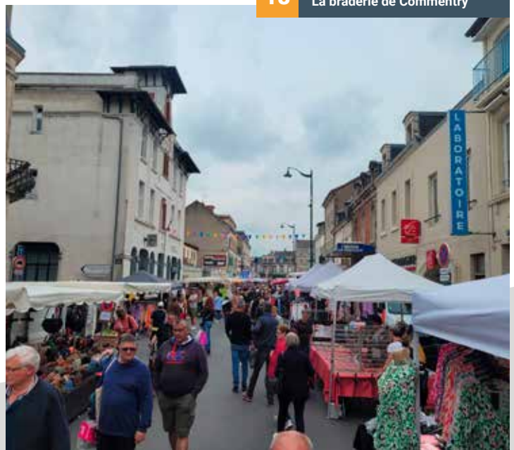
18 La braderie de Commentry