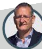
Sylvain BOURDIER Maire de Commentry