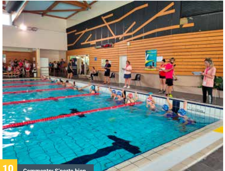
10 Commentry S'porte bien